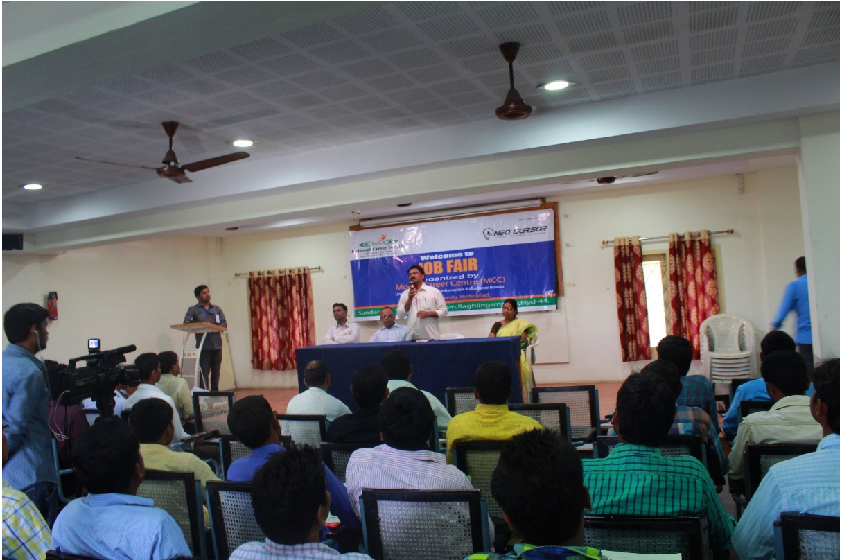
Photos of first Job Mela at SundrayaVingnanaKendram, Hyderabad on 23.08.16